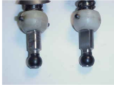
純正部品との比較