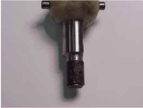
磨耗したブッシュ